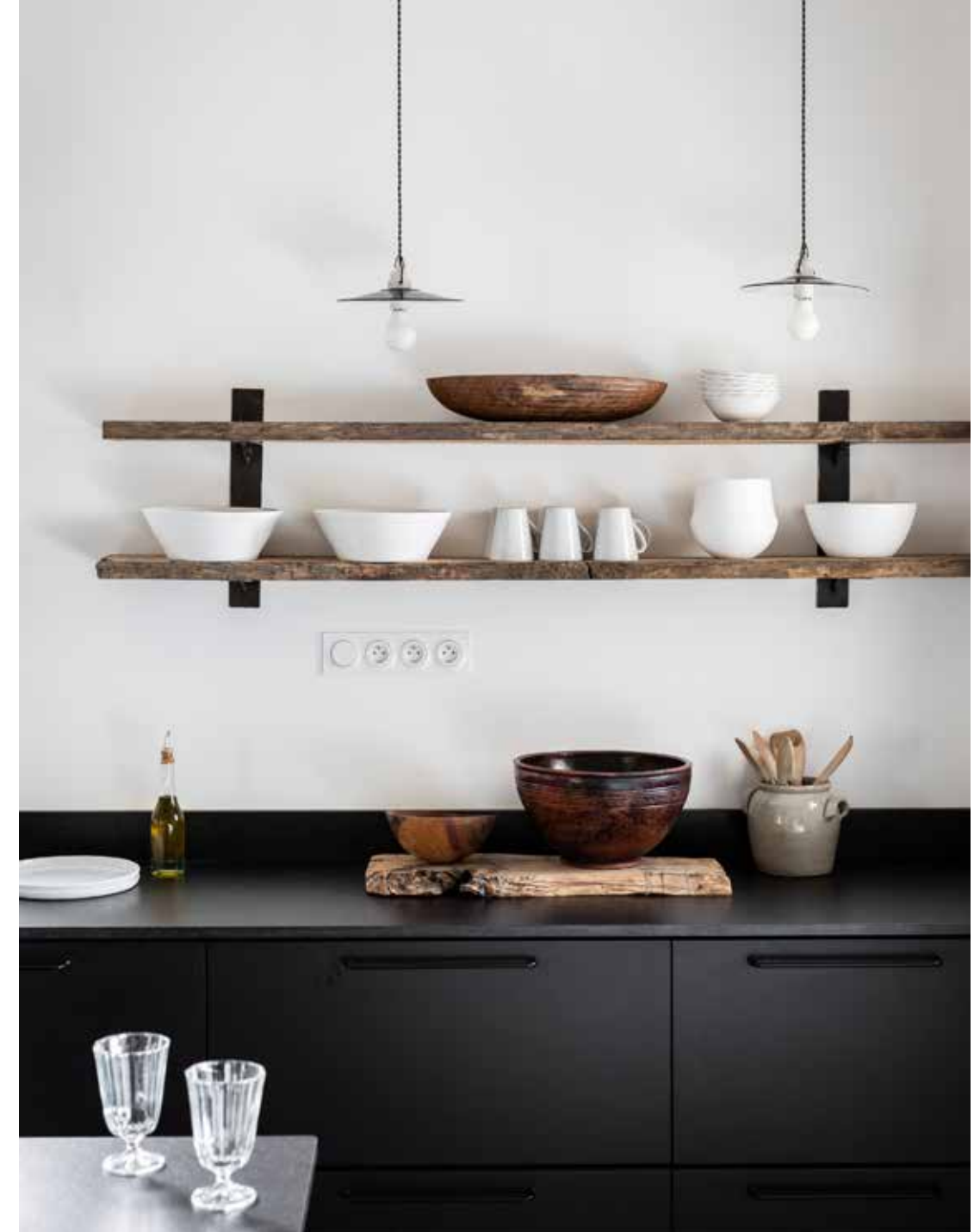
Het oude, ruwe hout van de wandplanken maakt het zwart van de keuken warmer. De witte muur houdt het fris.