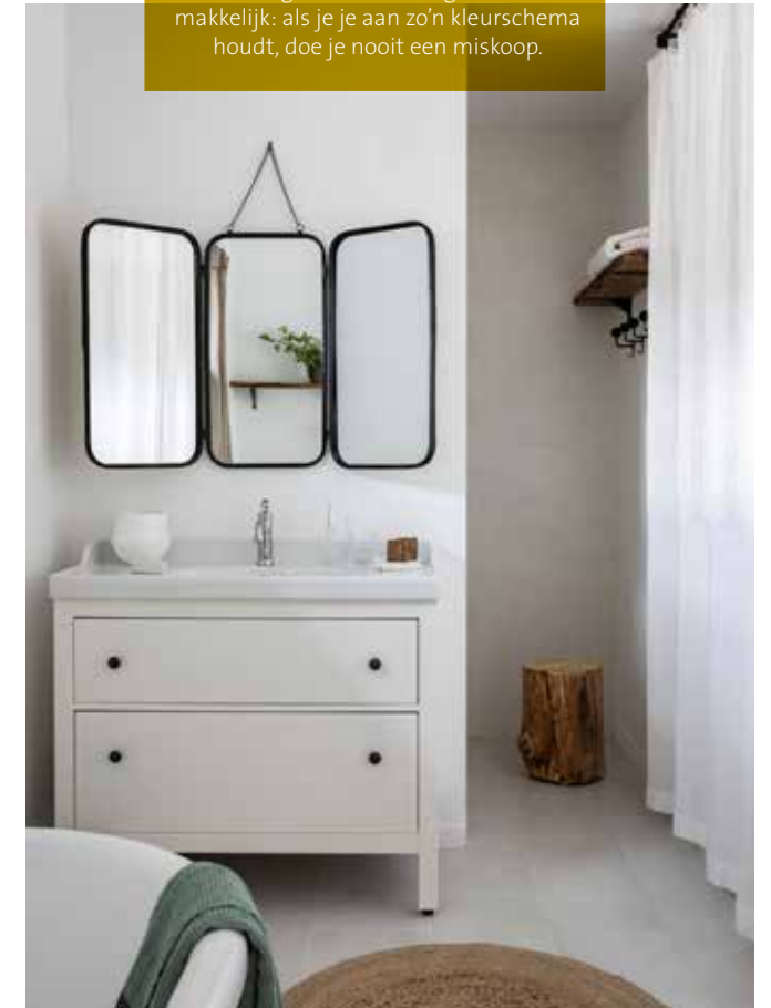
De slaapkamers bevinden zich in de aanbouw. Ze hebben elk hun eigen badkamer.

“We hebben de kleuren van de gebruikte materialen als uitgangspunt genomen”